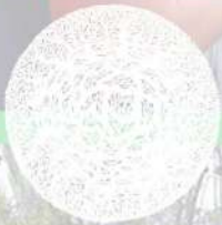
Heike Freire Salud, bienestar y aprendizaje